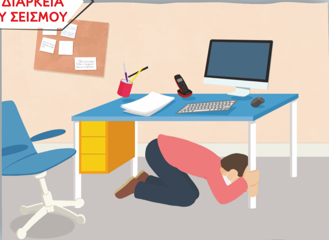
Κάλυψη κάτω από γραφείο κρατώντας το πόδι του