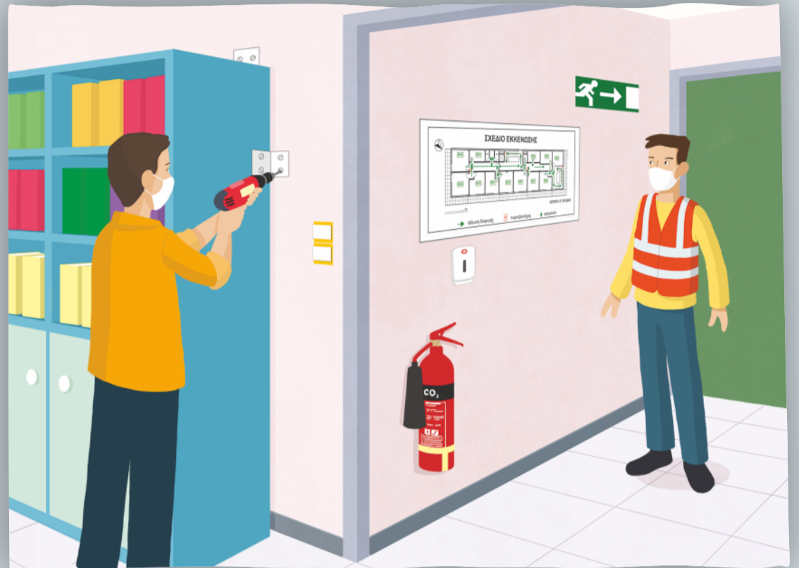
Επισήμανση και άρση επικινδυνότητας