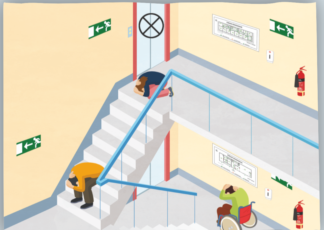
Αποφυγή μετακίνησης. Μείωση του ύψους και κάλυψη