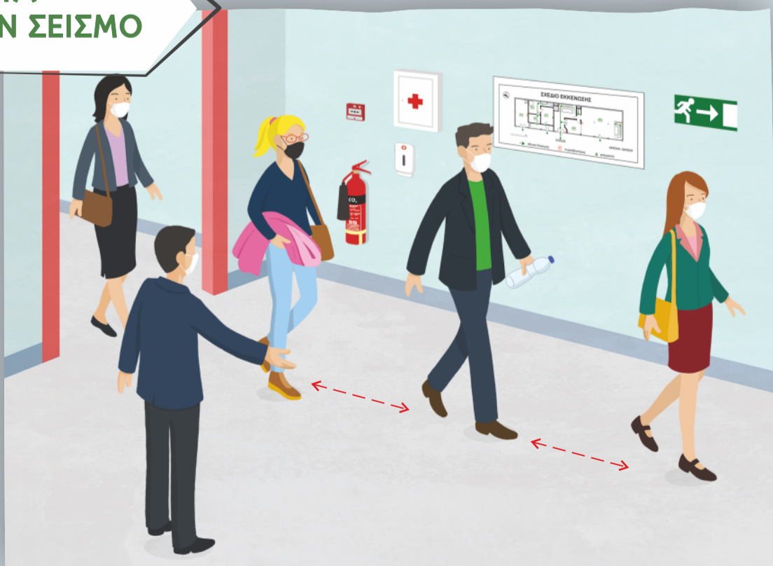
Εκκένωση κτιρίου με ψυχραιμία